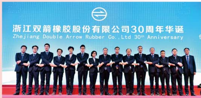
公司高管在30周年庆典上合影留念