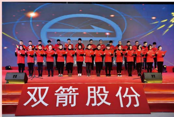
公司员工献唱《双箭之歌》