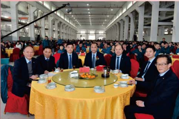
公司功勋之星合影留念

白驹过隙，时光荏苒，转眼间双箭股份已经走过了30年的发展历程。30个春秋里既有沉甸甸的收获又有崭新的时代梦想，30年记录着步履的铿锵与奋进的昂扬。