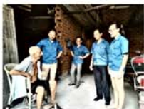
2018年8月31日 星期五 投稿: news@doublearrow.com

整个走访活动约两小时。通过活动，我们看到了困难群众的生活现状，对深入推进“两学一做”学习教育常态化制度化有了清醒认识，今后公司党委将继续与结对困难家庭加强工作联系，做好帮扶工作。